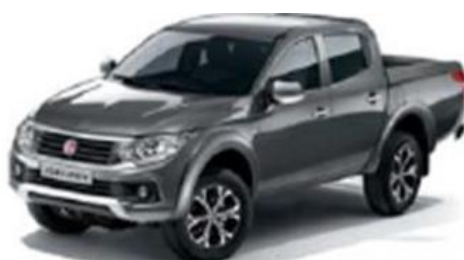
480 Titanium Grey