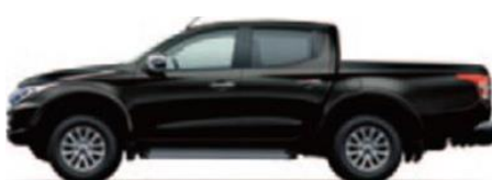
Black Mica (X08)