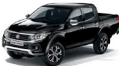
555 Black (Mica)